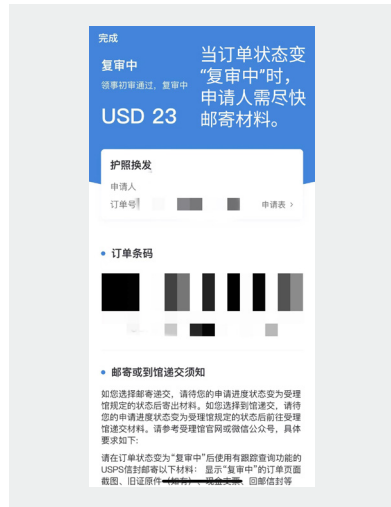
“中国领事”APP 订单信息页截图复印件(示例)

对于特殊情况, 申请者需要提交的额外材料会有所不同。例如, 在美国出生且至少一方父母为中国公民的申请者, 如果中国籍父母在孩子出生时未取得美国或其他国家的永久居留权, 申请人须额外提供出生证或其他具有法律效力的亲子关系证明复印件。这些材料需与在“中国领事”APP上传的材料保持一致, 以证明申